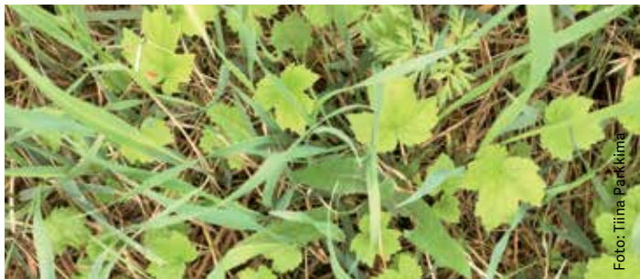
När de unga bladen av jätteloka kommer upp ur marken påminner de om lönnlöv i miniatyr.