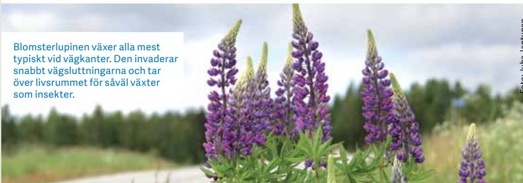
Blomsterlupinen växer alla mest typiskt vid vägkanter. Den invaderar snabbt vägslutningarna och tar över livsrummet för såväl växter som insekter.

Målarterna i den här guiden: jättelokorna, jättebalsaminen, vresrosen, blomsterlupinen, jättesliden, hybridsliden och parksliden finns på listan över främmande arter som ska bekämpas enligt lagen om hantering av risker orsakade av främmande arter. Det är förbjudet att föra in dessa arter i landet, att sälja, odla, använda, inneha och sprida dem i naturen. En fastighetsägare måste göra sig av med planteringar av sådana arter, och om växterna också har spridit sig till andra ställen på fastigheten kan ägaren vara skyldig att utrota dem. Enligt lagen får inga främmande arter hållas, odlas, planteras, sås eller på annat sätt hanteras på ett sådant sätt att de kommer åt att sprida sig i omgivningen.