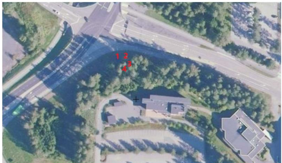
Kuva 1. Ote hakemuksesta, kaadettavaksi esitetyt puut.

Poikkeuslupaa haetaan neljälle puulle, joista kolme on jo kuollut ja yksi heikkokuntoinen. Poikkeuslupahakemuksen liitteenä on esitetty Jyväskylän Arboristipalvelu Oy:n laatima puiden kuntoarvio, jossa puut on todettu riskipuiksi. Riskipuut ovat kaksi kuollutta kuusta (kuvassa 1 numeroilla 1 ja 2), joista toiseen on iskenyt salama, yksi kuollut haapa (nro 3) ja yksi harsuuntunut kuusi (nro 4).