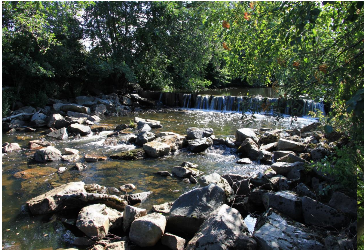
Teräsponttipato (alin pato) 75 cm pudotuskorkeus