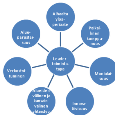
Kuva 8. LEADER-periaatteet, joihin paikallinen kehittäminen pohjautuu (Manner-Suomen maaseudun kehittämisohjelma 20014-2020 luonnos).

Paikallista kehittämistä rahoitetaan Etelä-Savon maaseudun kehittämisohjelmassa pääsääntöisesti toimintaryhmyillä ja LEADER-menetelmällä. Etelä-Savon kehittämissuunnitelman tässä vaiheessa varsinaista hakua toimintaryhmiksi ei ole vielä avattu. Parhaillaan tätä työtä alueella tekevät neljä toimintaryhmää: Rajupusu LEADER ry, Veej'jakaja ry sekä Piällysmies ry sekä Päijänne Leader ry, joista jokainen on alustavasti hakenut viralliseksi toimintaryhmäksi. Näistä jälkimmäinen toimii Pertunmaalla ja kuuluu Hämeen ELY-keskuksen alueelle. Toimintaryhmien alueiden asukasluku vaihtelee 19 000 - 55 000 asukkaaseen.