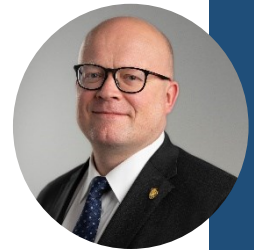
Mikko Hautala Washingtonin suurlähettiläs

Ilmoittautumislinkki: Päälliköt lavalla Lappeenranta 1.2.2024 mennessä