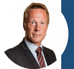
Okko-Pekka Salmimies Los Angelesin pääkonsuli