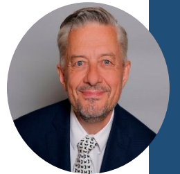
Jarmo Sareva New Yorkin pääkonsuli