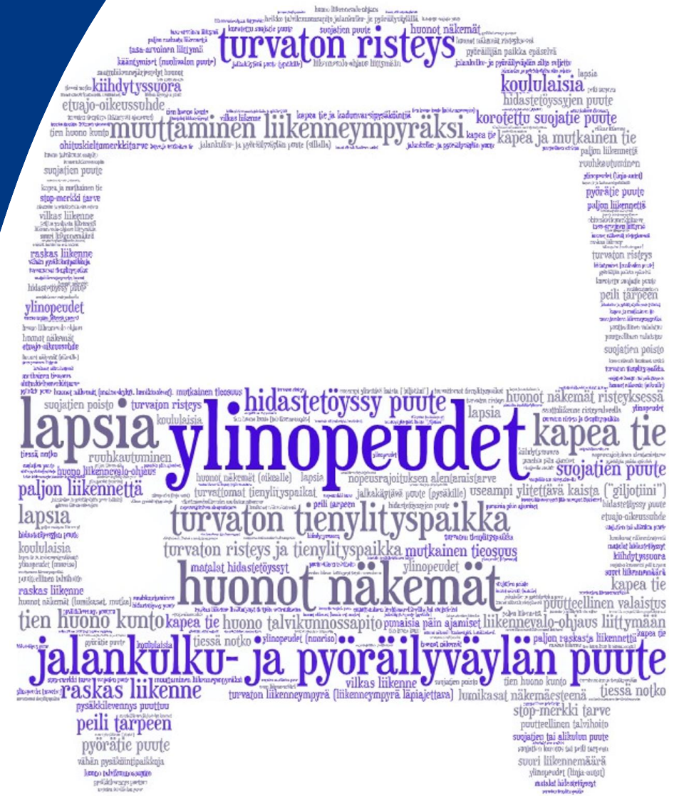
Asukaskyselyn sanapilvi (koko seudun vastaukset)