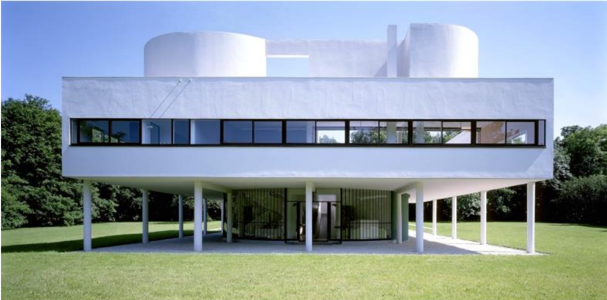
Le Corbusier: Villa Savoye, 1931

Ornamentit voivat henkiä aiempia tyylejä myös uusissa rakennuksissa.