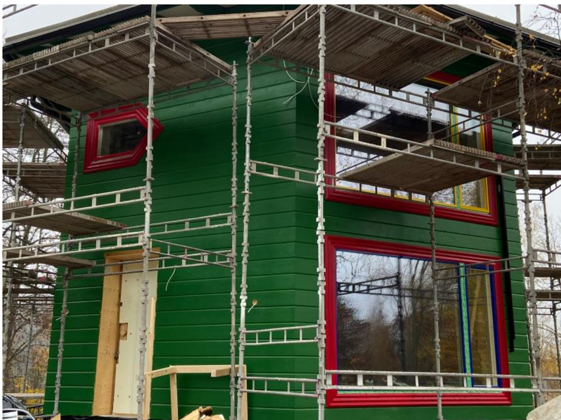
Jan-Erik Andersson & Erkki Pitkäranta: Kuusi-o-talo, Turku, 2023.

Pieni nuolenmuotoinen ornamentti-ikkuna ja vastapainoksi isot ikkunat valoisuuteen.