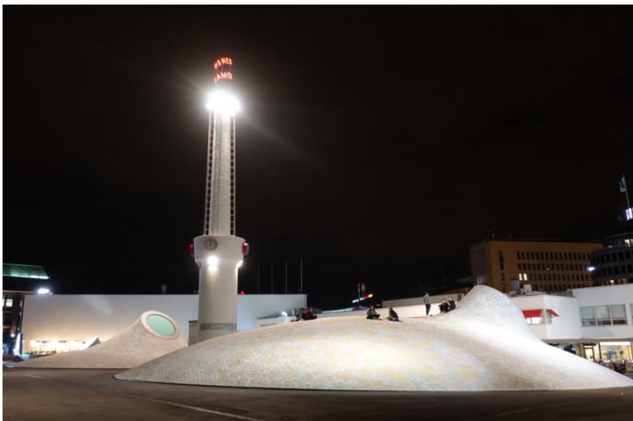
Amos Rexin maanalaisten museotilojen kattomuodot näkyvät maan päälle.