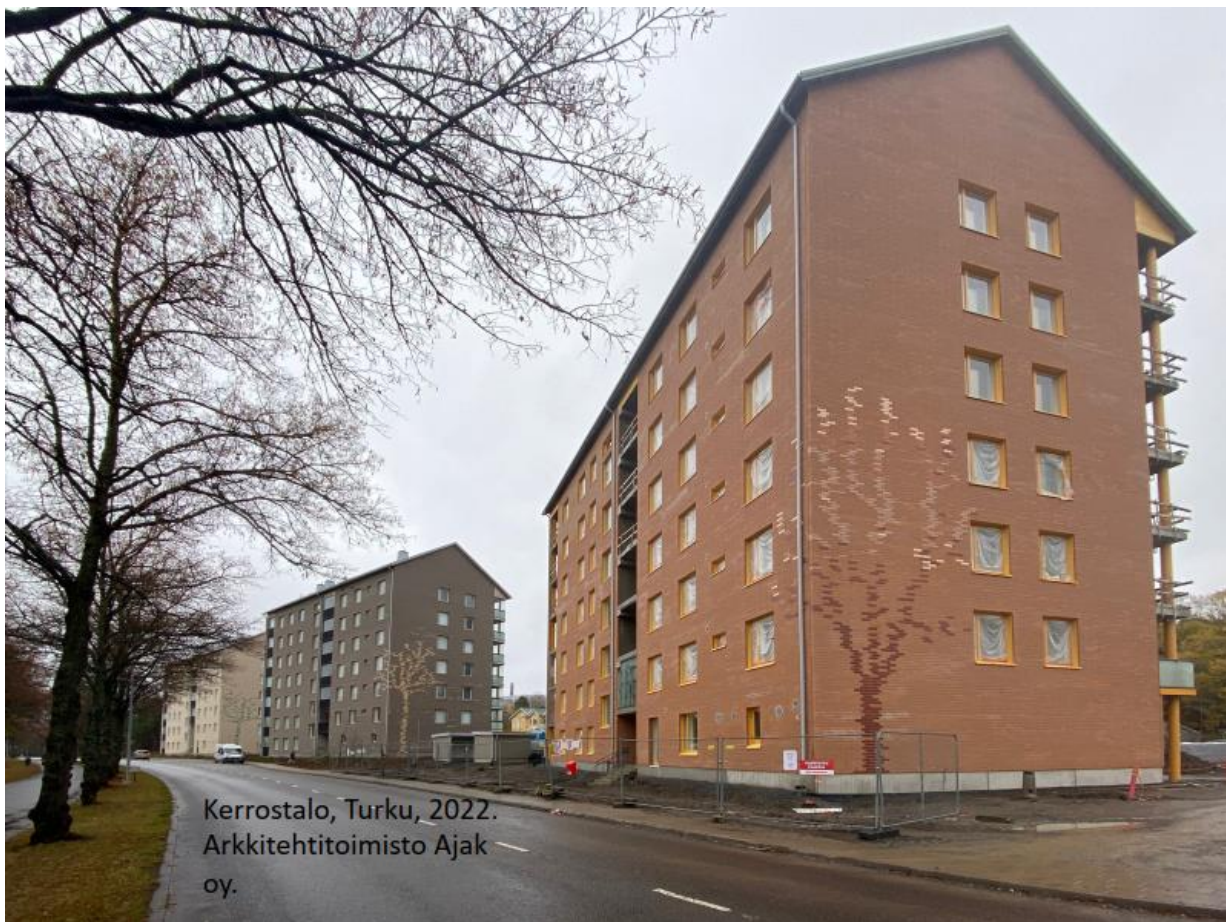
Esimerkki yksinkertaisesta tiiliornamentista.