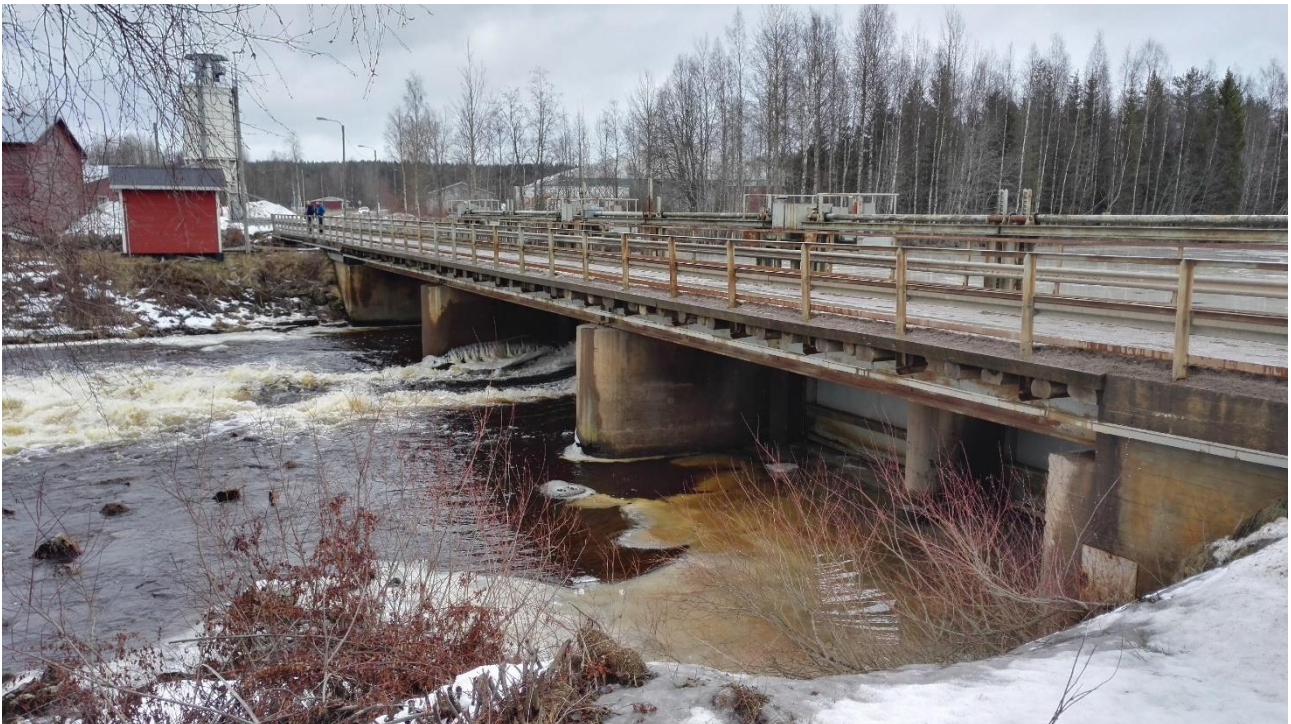
Haapakosken säännöstelypato

Haapajärven vedenkorkeutta säännöstellään Haapakosken säännöstelypadolla. Järven säännöstelylupa on Haapajärven järjestely-yhtiöllä, joka on siirtänyt käytännön säännöstelytehtävät Koskienergia Oy:lle sopimuksen perusteella. Säännöstelyn tarkoituksena on Haapajärven ylävirran puolella olevan tulva-alueen vapauttaminen haitallisista vedenkorkeuksista.