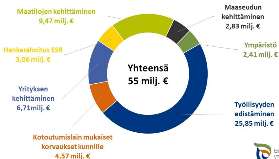
KUVA 1. Hämeen ELY-keskuksen rahoitus Hämeessä tammi-kesäkuussa 2021.