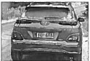
Testattu sähköauto oli miellyttävän hiljainen.

pitää palkkansa, mutta elinkaaren hitakan pidentyessä homma on tasassa ja sitten alkaa sähköauton ympäristöystävällisyys yllätyä. Näin etenkin Suomessa, jossa 70 prosenttia sähköstä tuotetaan ymjärätön kannalta puhtain menetelmin. Ikävä dilemma on se, että johtavat sähköautoamat Saksa ja Kiina tuottavat pääosan sähköstään likaisiin hiilimentelmin.