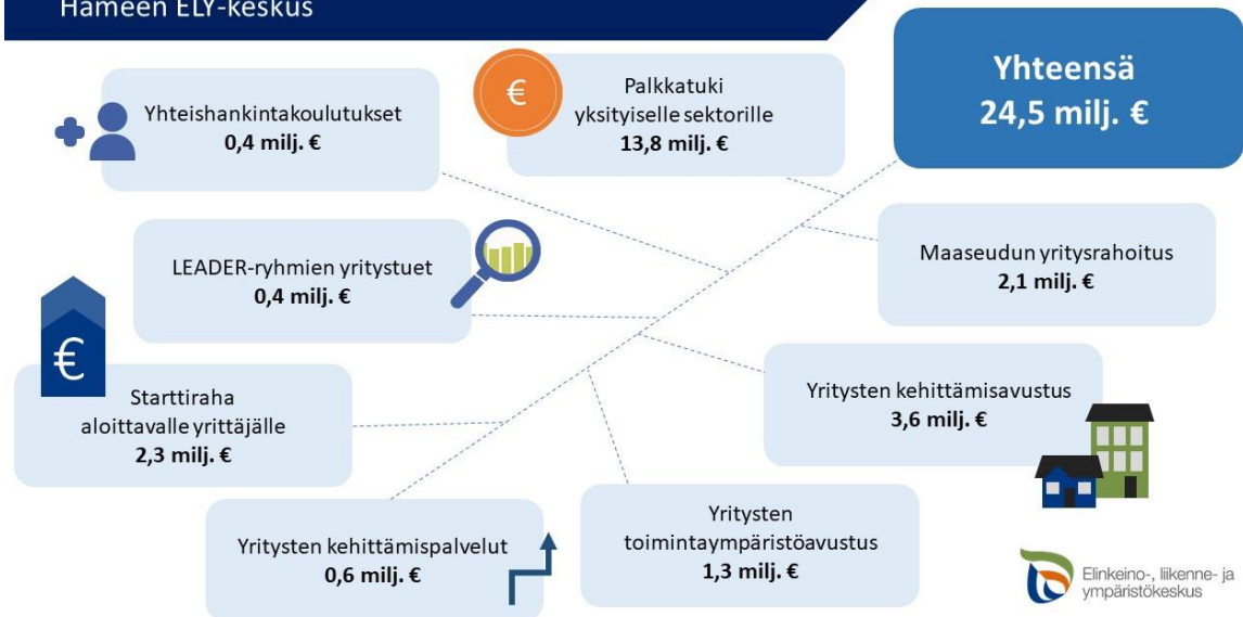
KUVA 2. Hämeen ELY-keskuksen yrityksiin kohdistunut rahoitus vuonna 2018.