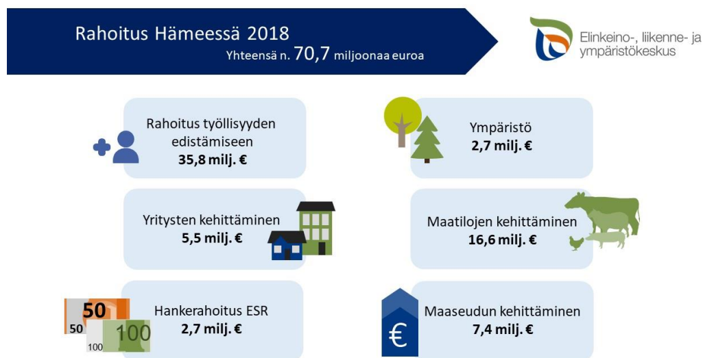
KUVA 1. Hämeen ELY-keskuksen rahoitus Hämeessä vuonna 2018.

ELY-keskus myönsi vuonna 2018 Hämeeseen rahoitusta lähes 71 miljoonaa euroa. Rahoituksen kokonaistaso kasvoi hieman edellisvuodesta, sillä vuonna 2017 myönnetyn rahoituksen määrä oli noin 68 miljoonaa euroa.