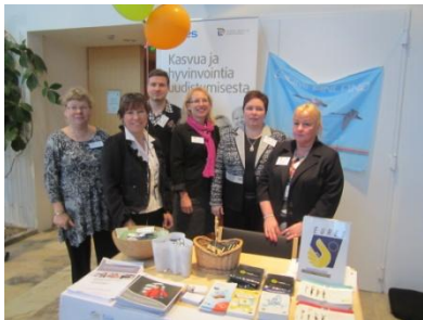
ELY-keskuksen henkilöstöä standilla.

Team Finland on verkostomainen toimintamalli Suomen taloudellisia ulkosuhteita, maakuva, kansainvälistymistä sekä ulkomaisten investointien edistämistä koskevien palveluiden tuottamiseen. Ohjaavia ministeriöitä ovat TEM, UM ja OKM. Toiminnan ytimen muodostavat julkisrahoitteiset organisaatiot: ELY-keskukset, TE-toimistot, Tekes, Finnvera ja Finpro yhteistyökumppanien kanssa. Maakunnissa verkostoon liittyvät myös