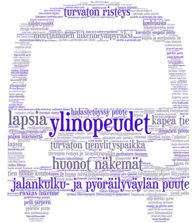
Asukaskyselyn sanapilvi (koko seudun vastaukset)