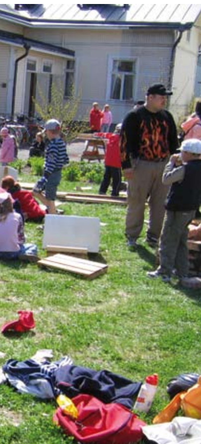
Lasten rakennuspaja rakennuskulttuuritalo Toivon pihamaalla Porissa.