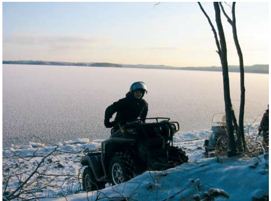
Koulutuskeskus sijaitsee oivalla paikalla Asikkalanselän rannassa

http://www.salpaus.fi/salpaus/yleista/yhteystiedot/