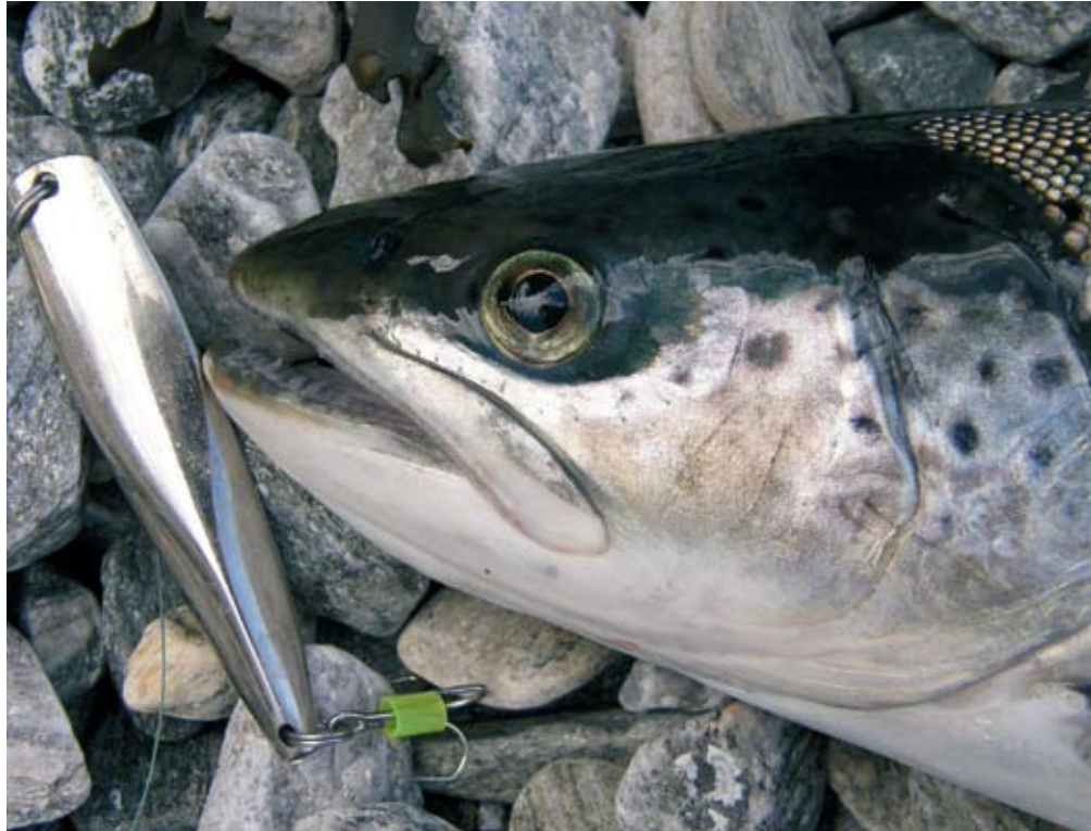
Taimenen saa harvoin pilkillä, mutta joskus lykää.

Suurin syy heikkoon istutustuottoon oli kalojen liian tehokas pyynti. Saalis korjataan aivan liian nuorena, eikä lisäkasvua ehdi juuri tapahtua. Kaksivuotiaista taimenista hieman yli puolet pyydettiin jo istutusvuoden aikana ja noin kolmannes seuraavana vuonna. Vastaavat osuudet järvilohilla olivat 78 % ja 17 %. Synkin puoli asiassa on, että istukkaiden ohella saaliissa on korvaamattoman arvokkaita luonnossa syntyneitä vaeltavia taimenia. Nämä kalat tunnistaa Päijänteellä leikkaamattomasta rasvaevästä. Leikkaamaton kala on aina vapautettava, jos suinkin on mahdollista. Viisainta on jättää pyydykset laskematta sellaisille alueille, joissa näitä uhanalaisuuksia eniten liikkuu. Hot spotteja ovat lisääntymisjokien ohella jokien suualueet sekä kalojen nousuväylillä olevat salmet ja kapeikot.