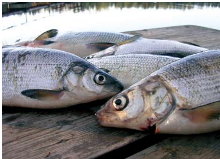
Hämeen ja Pirkanmaan harvalukuiset ammattikalastajat tavoittelevat pääasiassa muikkuja, kuhia ja täplärapuja. Siikoja saadaan lähinnä sivusaaliina.

Ammattikalastuksen vesienkäytönsuunnittelua varten käytiin läpi kalastusalueiden voimassa olevat käyttö- ja hoitosuunnitelmat, aiemmat ammattikalastusta koskevat selvitykset, sekä selvitettiin ammattikalastuksen alueellisia edellytyksiä kalastusalueille ja alueen ammattikalastajille lähetetyin postikyselyin. Taustatietojen perusteella ammattikalastukseen soveltuvat järvet pisteytettiin Maa- ja metsätalousministeriön asettaman ammattikalastuksen kehittämissuunnitelman määrittelemillä kriteereillä. Pisteytyksen jälkeen vesistöt, joissa on edellytyksiä ammattimaiselle pyynnille, valittiin kalastusalueittain. Pääsääntöisesti parhaat edellytykset ammattikalastukselle ja ammattikalastuksen lisäämiselle ovat suurimmilla reittivesillä, erityisesti suurimmilla selkälakeilla. Suurella osalla ammattikalastukseen sopivista vesialueista harjoitetaan jo ammattimaista kalastusta ja ravustusta. Suunnitelman selvitysten perusteella lähes kaikilla kalastusalueilla on myös vesialueita joissa ammattikalastusta voidaan lisätä.