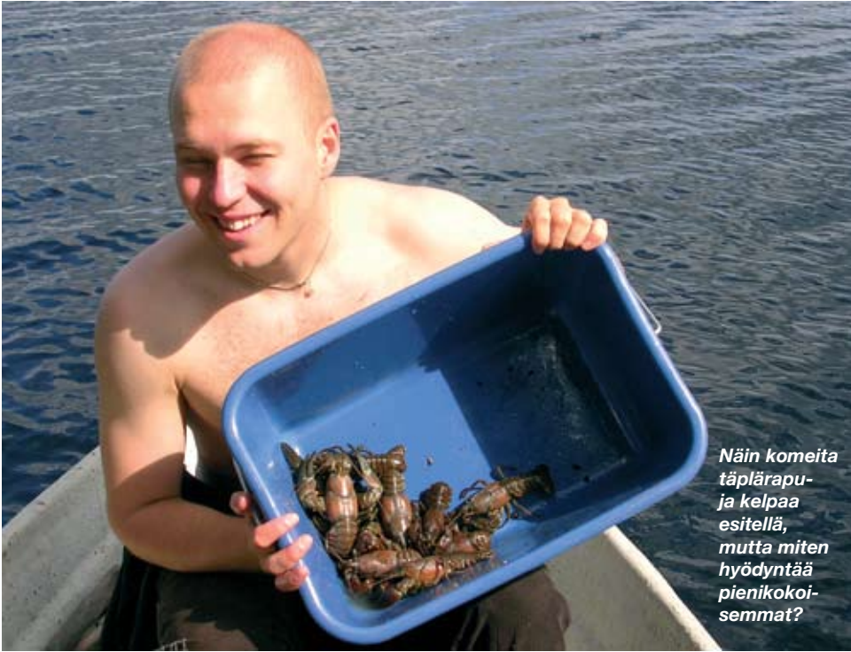
Näin komeita täplärapuja kelpaa esitellä, mutta miten hyödyntää pienikokoisemmat?