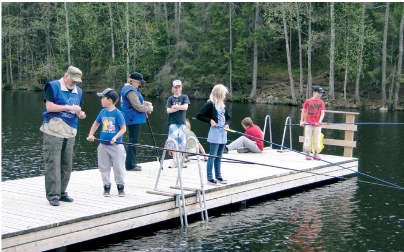
Jos perheessä ei saa kosketusta kalastukseen, hoituu homma näinkin!