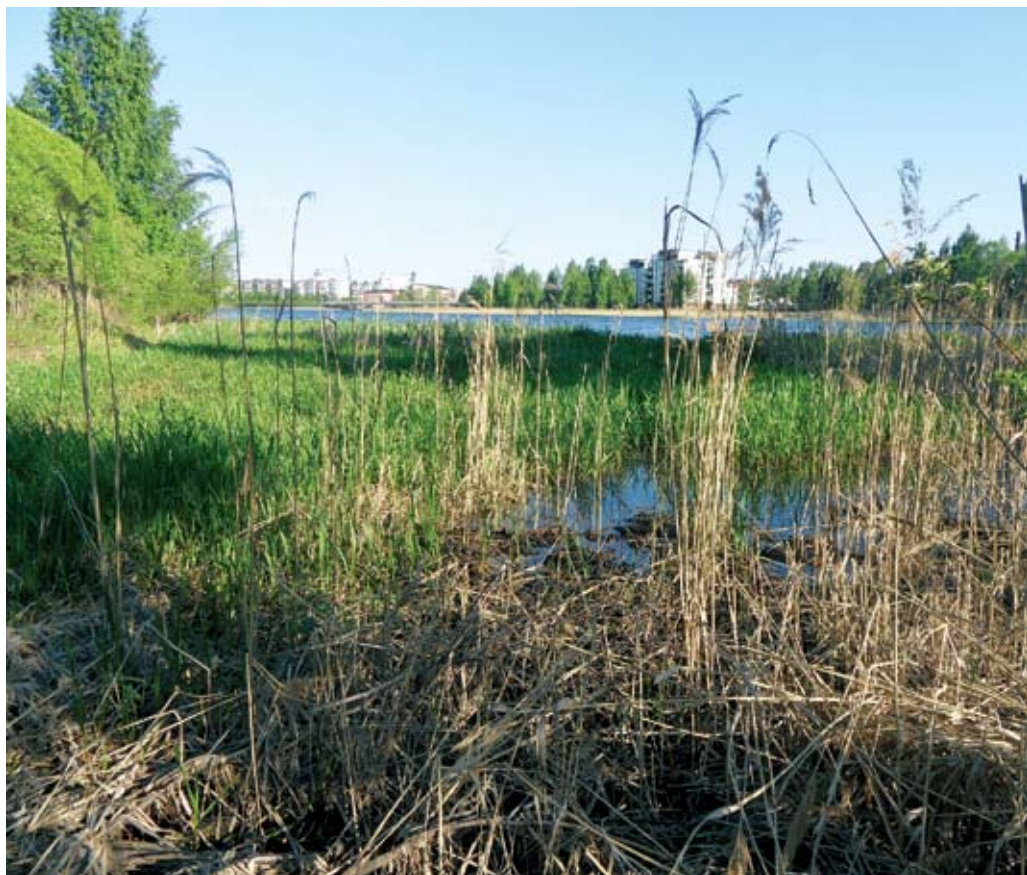
Ehdotuksia kunnostettavista kohteista tuli runsaasti. Rantojen umpeenkasvua esiintyy myös Hämeenlinnan ydinkeskustassa.

Yleissuunnitelmatyössä kuunnellaan vesistön eri käyttäjäryhmiä. Kaikki suunnitelmaan tulevat kohteet (lintuluotoja lukuun ottamatta) ovat vesistönkäyttäjien ehdottamia eli sellaisia kohteita, joissa virkistyskäyttö on vaikeutunut tai luonto- ja maisema-arvojen on havaittu heikentyneen. Kunnostuksen tarpeessa olevia kohteita kerättiin maaliskuun puolivälissä Hämeenlinnassa pidetyssä yleisötilaisuudessa ja niitä on voinut myös ehdottaa verkkopalvelun kautta Hämeen ELY-keskukseen.