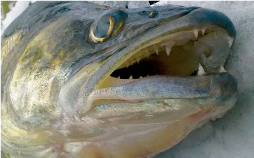
Kaksi paria hyviä kulmahampaita ja yksi kortti on ok