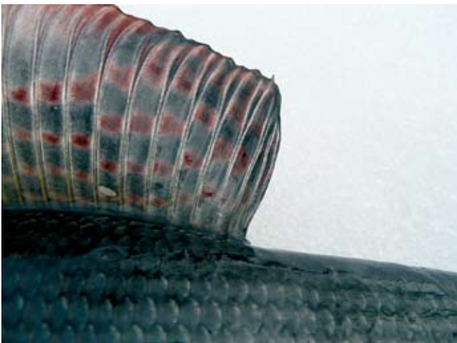
Tämäkin kalan 30 cm:n alamittaa valvotaan. Arvaa minkä kalan? Oikea vastaus väärinpäin: Sujrah

Lisää näitä näppäriä ohjeita löytyy julkaisusta: Suomen kansan muinaisia taikoja 2, kalastus-taikoja, Salakirjat Helsingissä 1892/2008. Hyvää kalakesää mökki-naapurille!