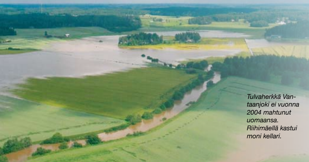
Tulvaherkkä Vantaanjoki ei vuonna 2004 mahtunut uomaansa. Riihimäellä kastui moni kellari.

Hämeen elinkeino-, liikenne- ja ympäristökeskus (ELY-keskus) on arvioinut tulvariskit Kanta-Hämeen ja Päijät-Hämeen alueilla. Arvioinnissa löytyi yksi alue, jolla veden noususta aiheutuva riski voi olla merkittävä. Maa- ja metsätalousministeriö nimeää tulvariskialueet ELY-keskuksen ehdotuksen perusteella.