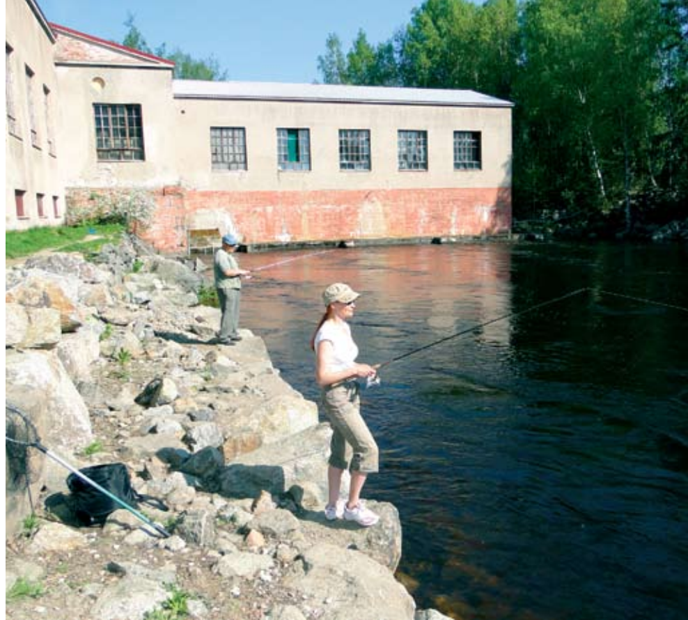
Monipuoliset kalastusmahdollisuudet ovat Hämeen ja Pirkanmaan valttikortteja. Siuronkoskella voi kalastaa kuhaa, taimenta ja toutainta tennarit jalassa.

Alustava arviointi ja ehdotukset merkittäviksi tulvariskialueiksi on tehty vuonna 2010 voimaan tulleen tulvariskilain mukaisesti.