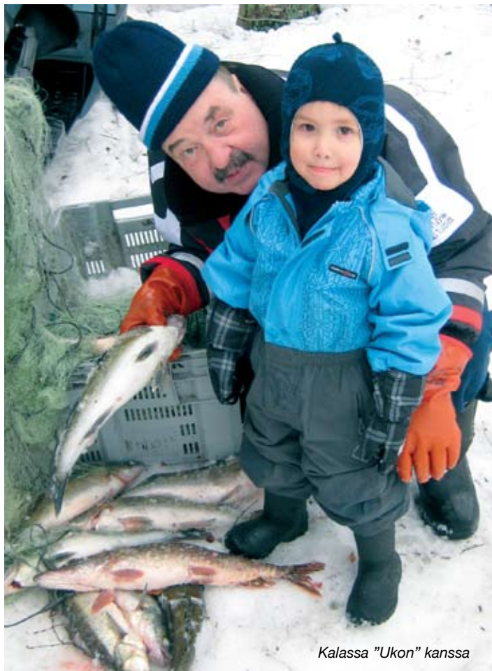
Kalassa "Ukon" kanssa

Onko kalastusalueiden toiminta vassannut odotuksia, joita sinulla alueita suunnitelleen lautakunnan sihteerinä 1980-luvun alkupuolella oli?