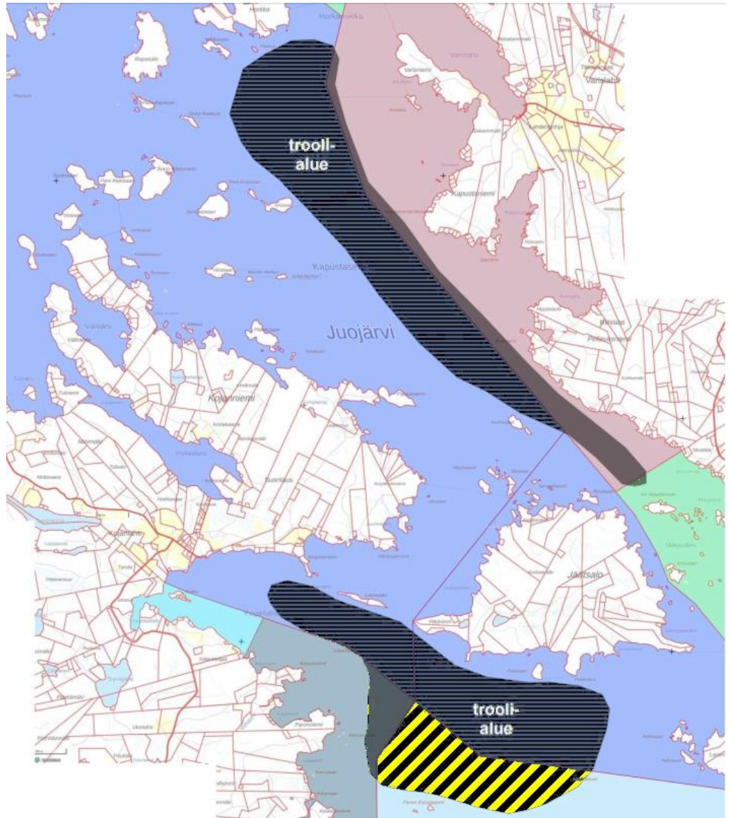
Kuva 1. Hakijan voimassa olevat trooiluvat Kall 13 §:n mahdollistamilla lupa-alueilla (vaakaviivoitettu osa). Hakijan Kall 13 §:n mukaisesti hakema lupa-alue (kelta-musta vinoviivoitus, Juojärven osk 90-876-28-1 vesialueella).