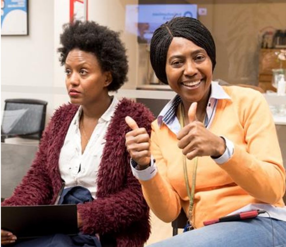
Kuvassa Think Africa ja Women designed for success - Wodess ry

Perinteinen kansalaistoiminta on myös tervetullutta palveluun, mikäli se haluaa toimia kotoutumisen tukena.