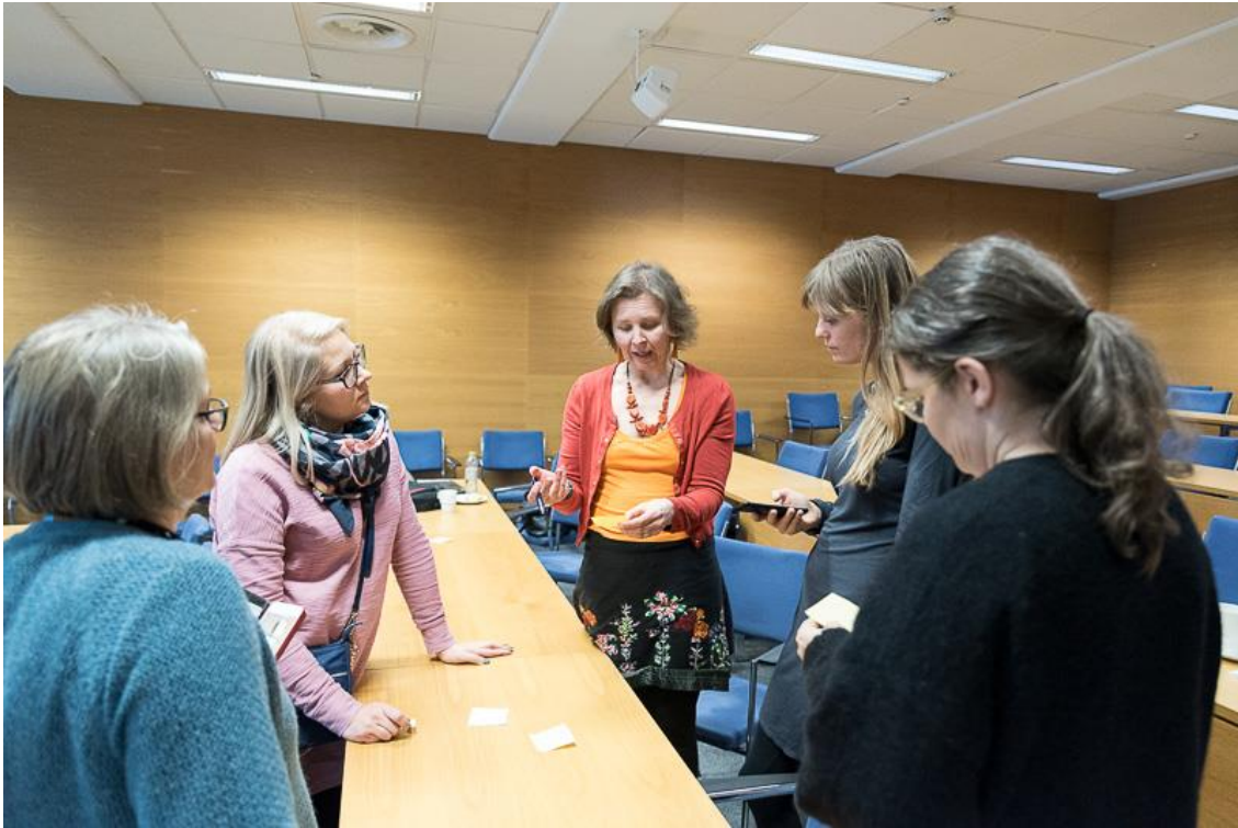
Kuva ELY-keskuksen Kotona Suomessa -hankkeen järjestämästä Maahanmuuttajien ja vieraskielisten ääni kuuluviin vaikuttavalla osallistamistyöllä -seminaarista 19.11.