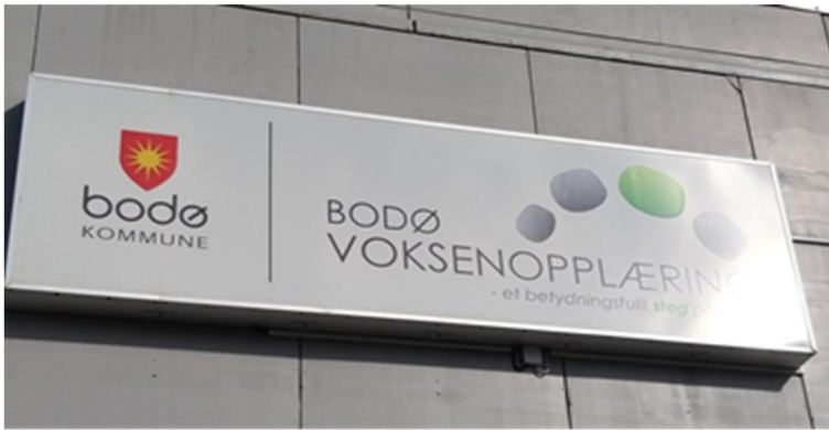
Kuva 6 Bodø'n kaupungin aikuiskoulutuskeskuksen kyltti

Vierailimme aamupäivän Bodø'n kaupungin aikuiskoulutuskeskuksessa, jossa oppilaitoksen rehtori Ole Hatlebrekke esitteli toimintaa.