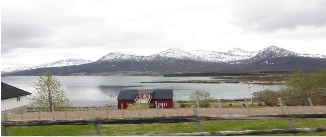
Kuva 2 Helnessund on syrjäinen saari noin tunnin ja kymmenen minuutin merimatkan päässä Bodøstä.

Matka Bodøstä Helnessundin saarella Steigenissa sijaitsevaan Cermaqin tehtaaseen kesti yhteensä noin kaksi tuntia. Pohjois-Norjan Nordlandin läänissä sijaitsevassa Steigenissä on noin 2500 asukasta ja kunnan työttömyys on alhainen, vain 1,4 %. Cermaq on Steigenin suurin työnantaja. Norjan työttömyysprosentti on 3,8 %, kun Nordlandissa se on 2,5 %.