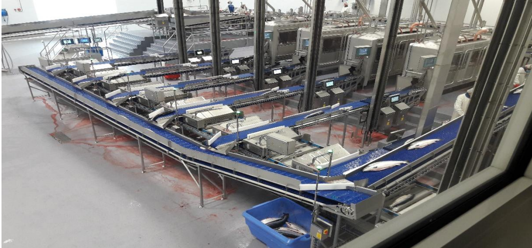
Kuva 3 Tehdastyöntekijät työskentelevät kaksi tuntia, jonka jälkeen on puolen tunnin tauko. Näin jatketaan kolme kertaa päivässä yhdessä vuorossa. Laadun varmistamiseksi tehdashallin lämpötila on 8 °C, joten tauot ovat tarpeen.

peruskielitaito norjasta ja työntekijöiltä edellytetään luku- ja kirjoitustaitoa. Englannin kielen käyttö sallitaan vain poikkeustilanteissa.