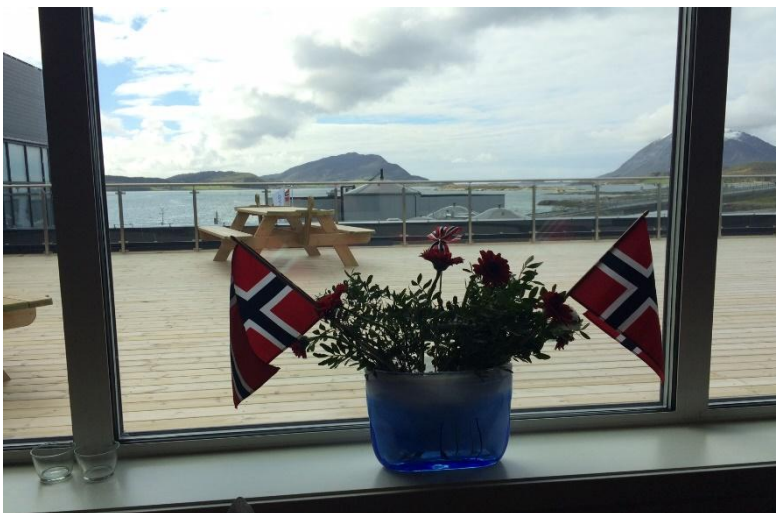
Kuva 4 Näkymä Cermaqin ruokalasta

Suurin osa maahanmuuttajataustaisista työntekijöistä on hankkinut asuntonsa itse, mutta Cermaq auttaa tarvittaessa kodin löytämisessä. Vapaita asuntoja ei ole helppo saarelta löytää, mutta monet ovat kuitenkin onnistuneet löytämään oman talon paikallisilta näiden muutettua pois. Kesämökkejä on myös saatu vuokralle yrityksen työntekijöitä varten. Maahanmuuttajat ovat kotoutuneet hyvin sekä yritykseen että yhteisöön. Vakituinen työ Cermaqissa on mahdollistanut oman kodin ostamisen, mikä työpaikan lisäksi juurruttaa maahanmuuttajia jäämään saareen.