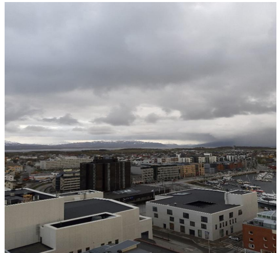
Kuva 1 Bodø:n kaupunkia

Bodø on myös mukana hankkeessa, jossa keskitytään alueen kehittämiseen, energiatehokkuuteen ja erilaisiin liikkumismuotoihin "ZEN The Research Center on Zero Emission Neighborhoods in Smart Cities". Tavoitteena on hyvä julkinen liikenne sekä pyöräilyn ja jalankulun helpottaminen. Kaupungin visiona on uusi, älykäs Bodø, joka on maailman ympäristöystävällisin kaupunki.