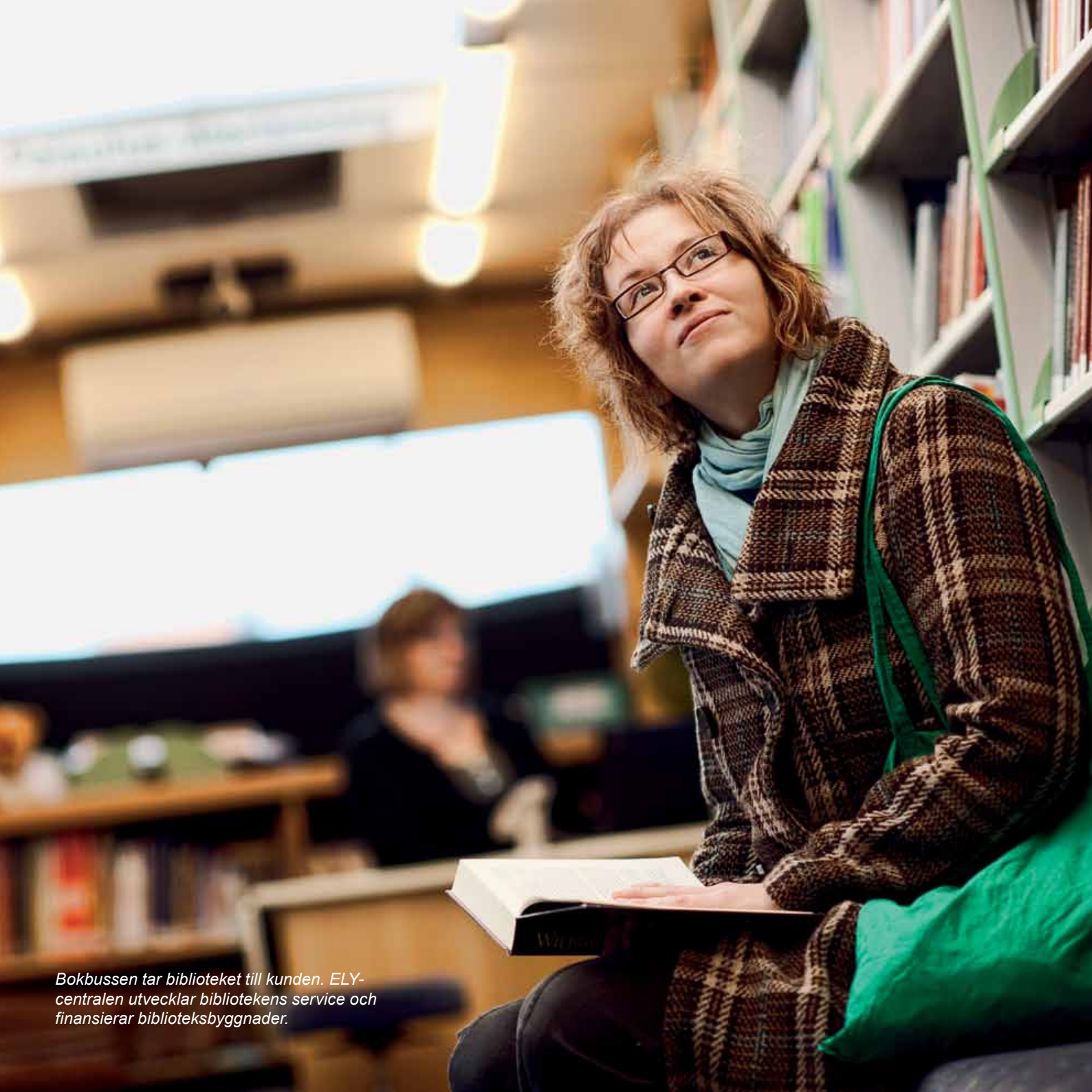
Bokbussen tar biblioteket till kunden. ELY-centralen utvecklar bibliotekens service och finansierar biblioteksbyggnader.