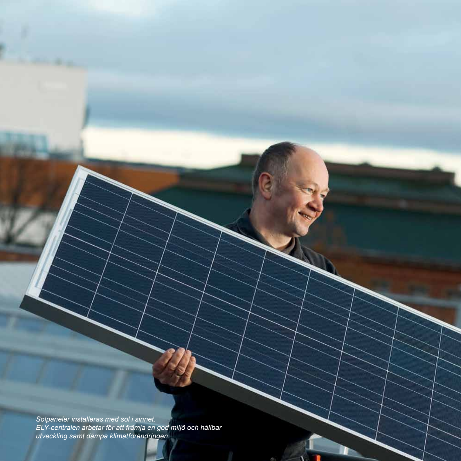
Solpaneler installeras med sol i sinnet. ELY-centralen arbetar för att främja en god miljö och hållbar utveckling samt dämpa klimatförändringen.