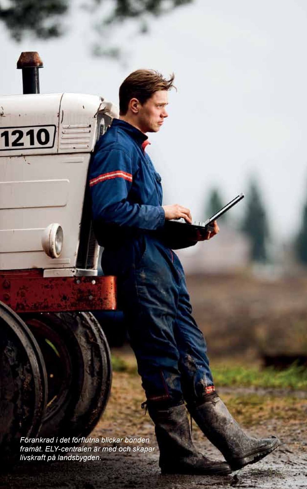
Förankrad i det förflutna blickar bonden framåt. ELY-centralen är med och skapar livskraft på landsbygden.