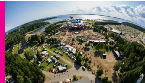
POKAT 2017 – Työtä, elinvoimaa ja hyvinvointia kestävästi Pohjois-Karjalaan

Pohjois-Karjalan maakuntaohjelma 2014–2017